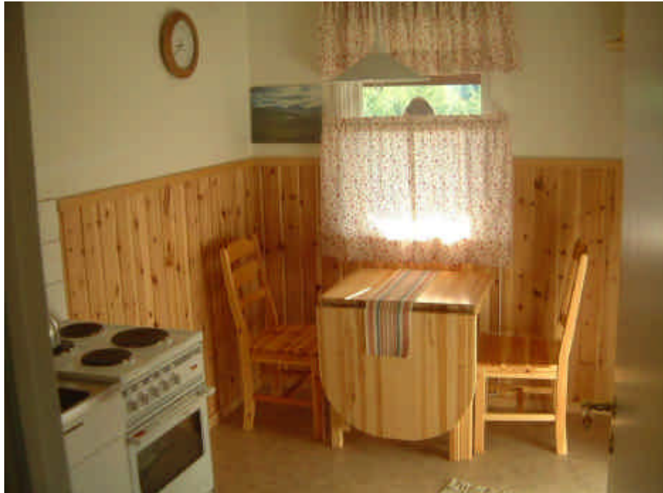
Kök i 2-bäddslägenhet