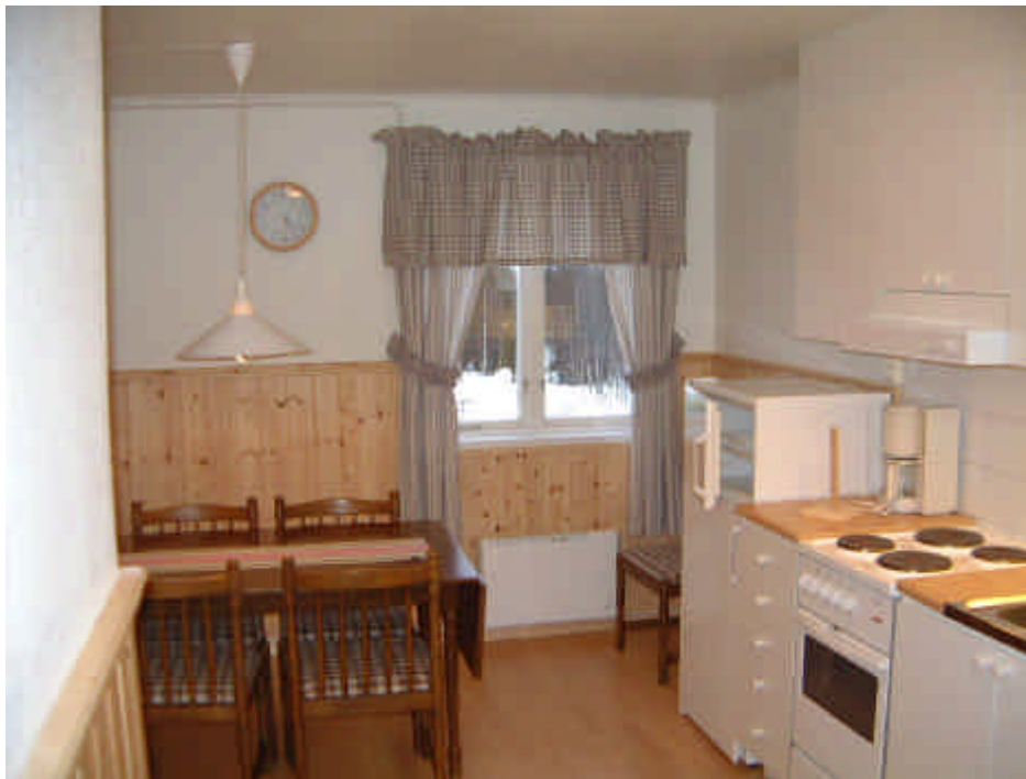
Kök i 5-bäddslägenhet