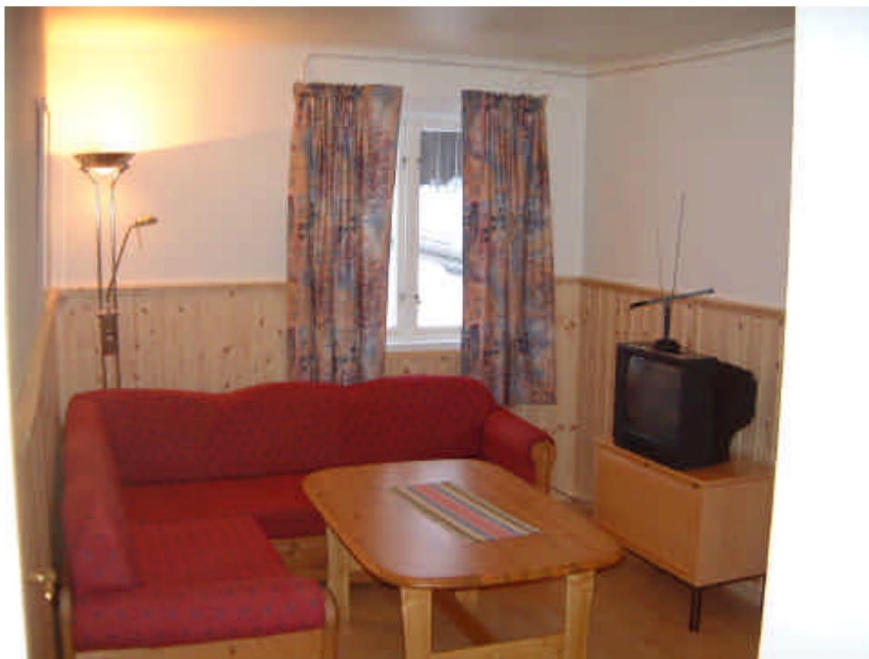
Vardagsrum i 5-bäddslägenhet