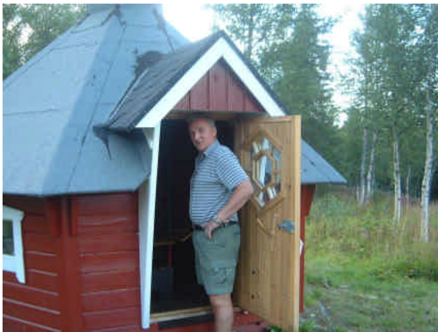
Grillkåta finns i anslutning till huvudbyggnaden.

Fjällgården har 2 och 5-bäddslägenheter med kök, huvudbyggnad med bastu, tvättstuga, samlingsrum med TV.